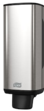
Tork Spender Schaumseife Stahl S4 460010