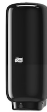
Tork Soap-Sanit Disp - Int Sens, bl 561608