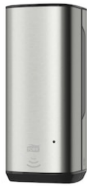
Tork Foam Soap Disp -Intuition sensor SS 460009