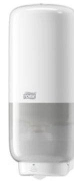
Tork Soap-Sanit Disp - Int Sens, wh 561600